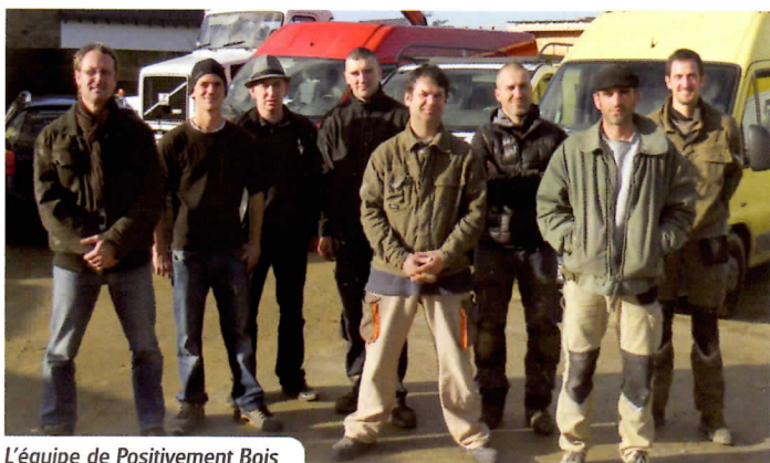
L'équipe de Positivement Bois